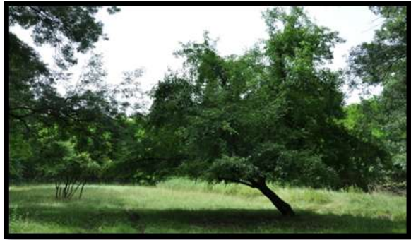
Az év fája a vadalma