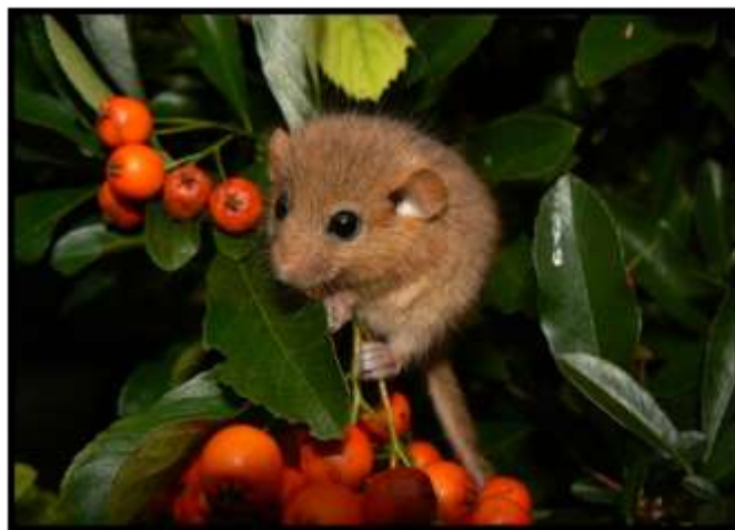
Az év emlőse a mogyorós pele