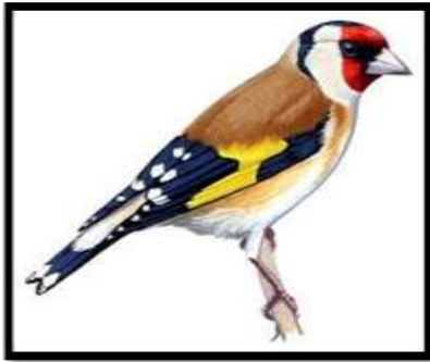
2017 madara a tengelic