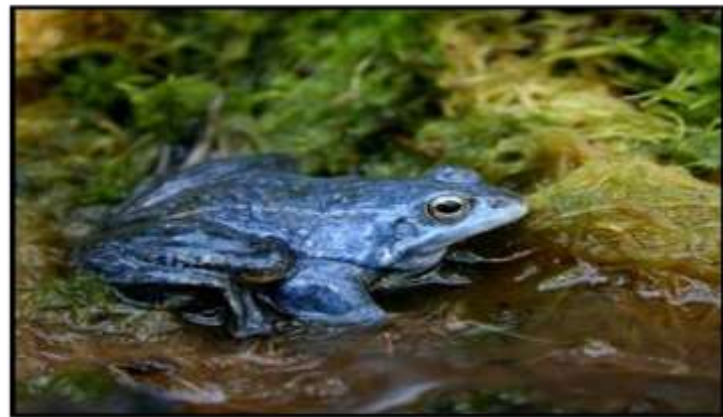
Az év kételtűje az égbék (mocsári békák kék nászruhában)

A Föld napja alkalmából április 21-e délelőttjén két hazai védett állatfaj is bemutatásra került. Az 5. osztályosok a fekete bödöncsigát mutatták be egy televíziós híradás keretében, míg a 6. osztályosok a mocsári teknőst, egy kedves jelenetbe ágyazottan.