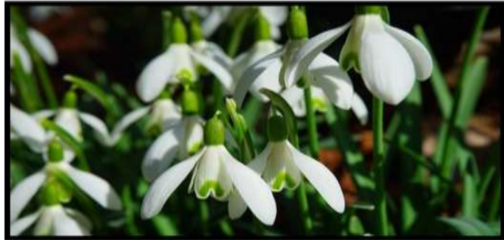
Az év vadvirága a hóvirág