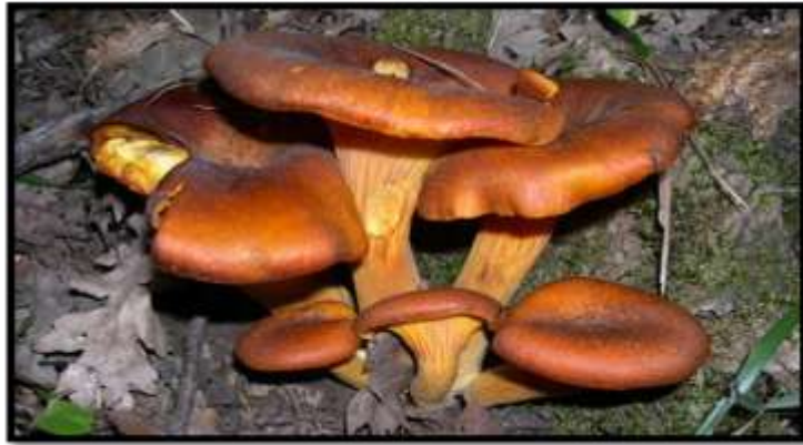
Az év gombája a világító tölcsérgomba