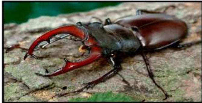
Az év rovara a nagy szarvasbogár